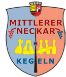
Bezirk Mittlerer Neckar Sektion Classic