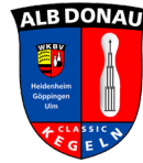
Bezirk Alb Donau Sektion Classic