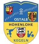
Bezirk Ostalb Hohenlohe Sektion Classic