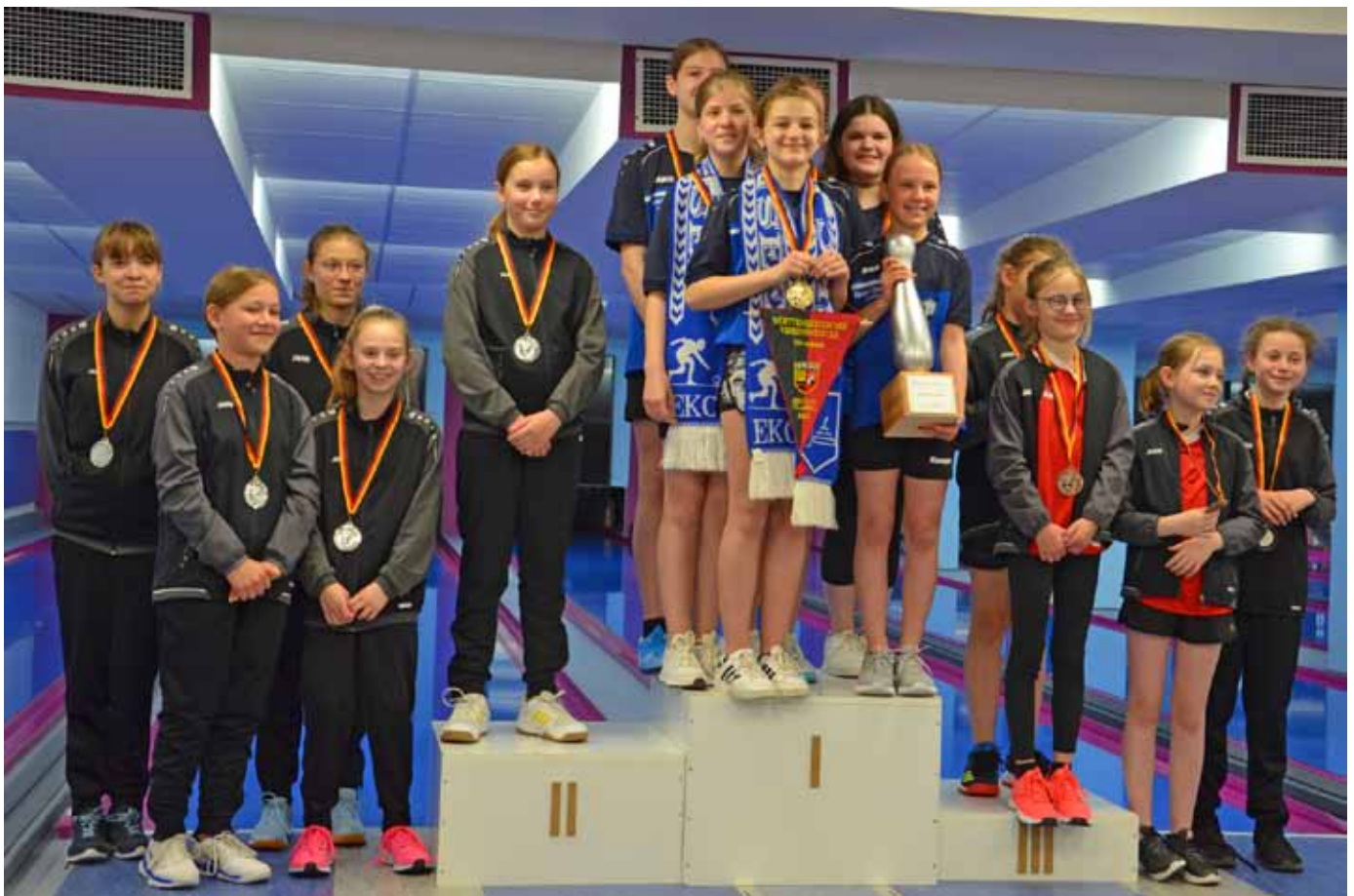
Siegerbild U14 w: v. l. KC Schwabsberg 1, EKC Lonsee, KC Schwabsberg 2.