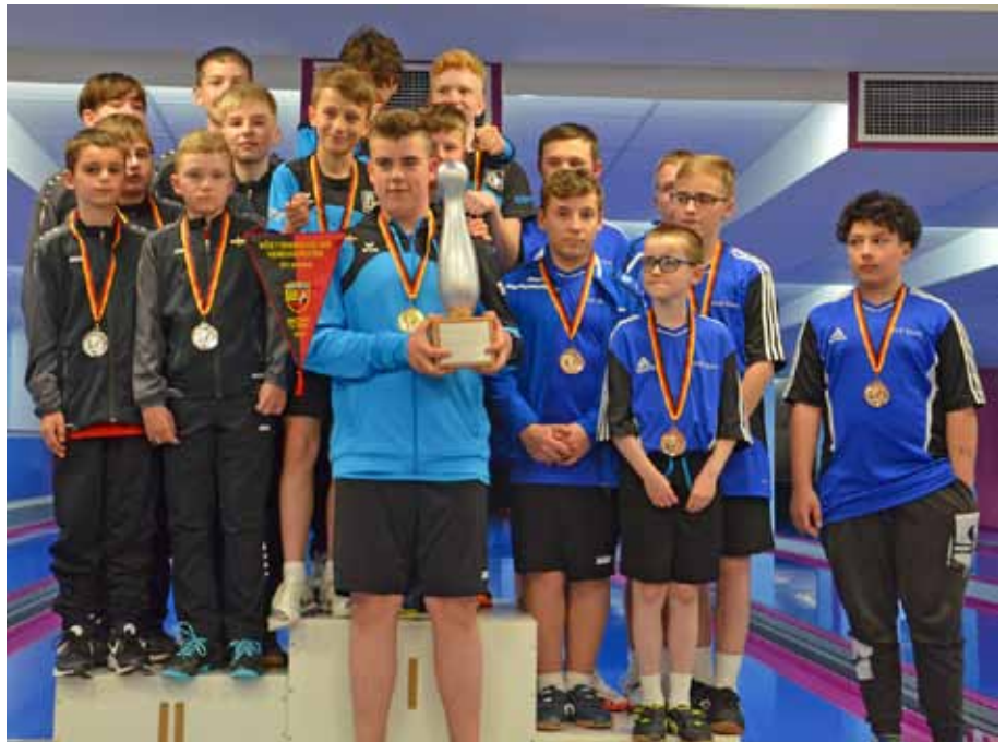
Sieger U14 m, v. l. KC Schwabsberg, SF Friedrichshafen, TSG Bad Wurzach.

Schwabsberg), die sich die Plätze zwei und drei erspielten.