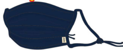
● 034 tinte