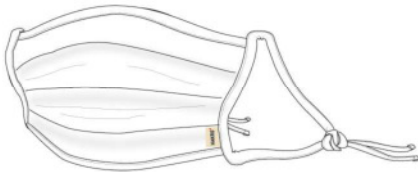
○ 001 weiß

Art.-Nr.: 75 28 26 03 Größe: one size Nasenbügel: 11-12 cm Fertigmaß: 17 x 9,2 cm Seitenband: 35,4 cm